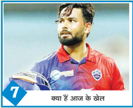
क्या हैं आज के खेल